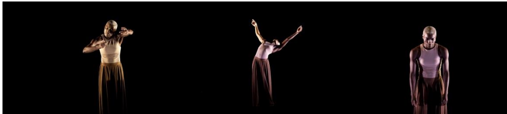
Compagnie A Corpo

Un solo qui exprime la nature humaine au-delà des apparences. Entre douceur, calme et force, l'interprète nous amène dans ses univers intimes avec discrétion, un voyage auquel nous ne restons pas indifférents.